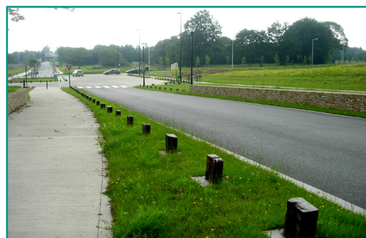
Intégration des giratoires aux espaces verts